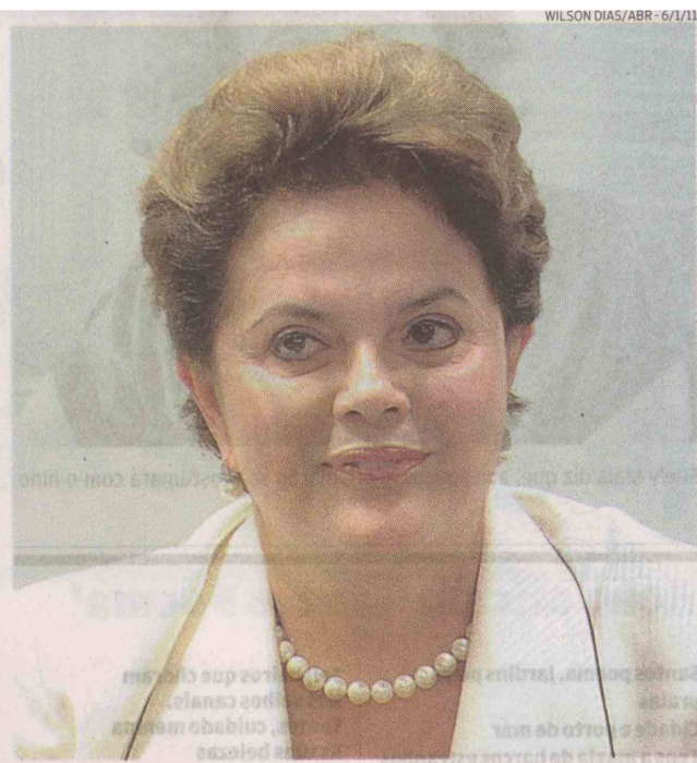
Administração da petista será positiva, dizem 64,5% dos pesquisados