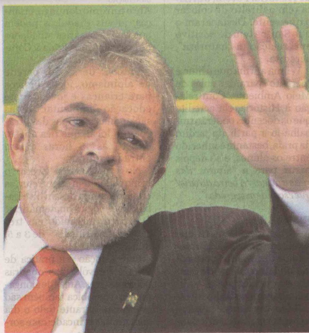
Ex-presidente se sobressaiu em cidades mais pobres, como Guarujá